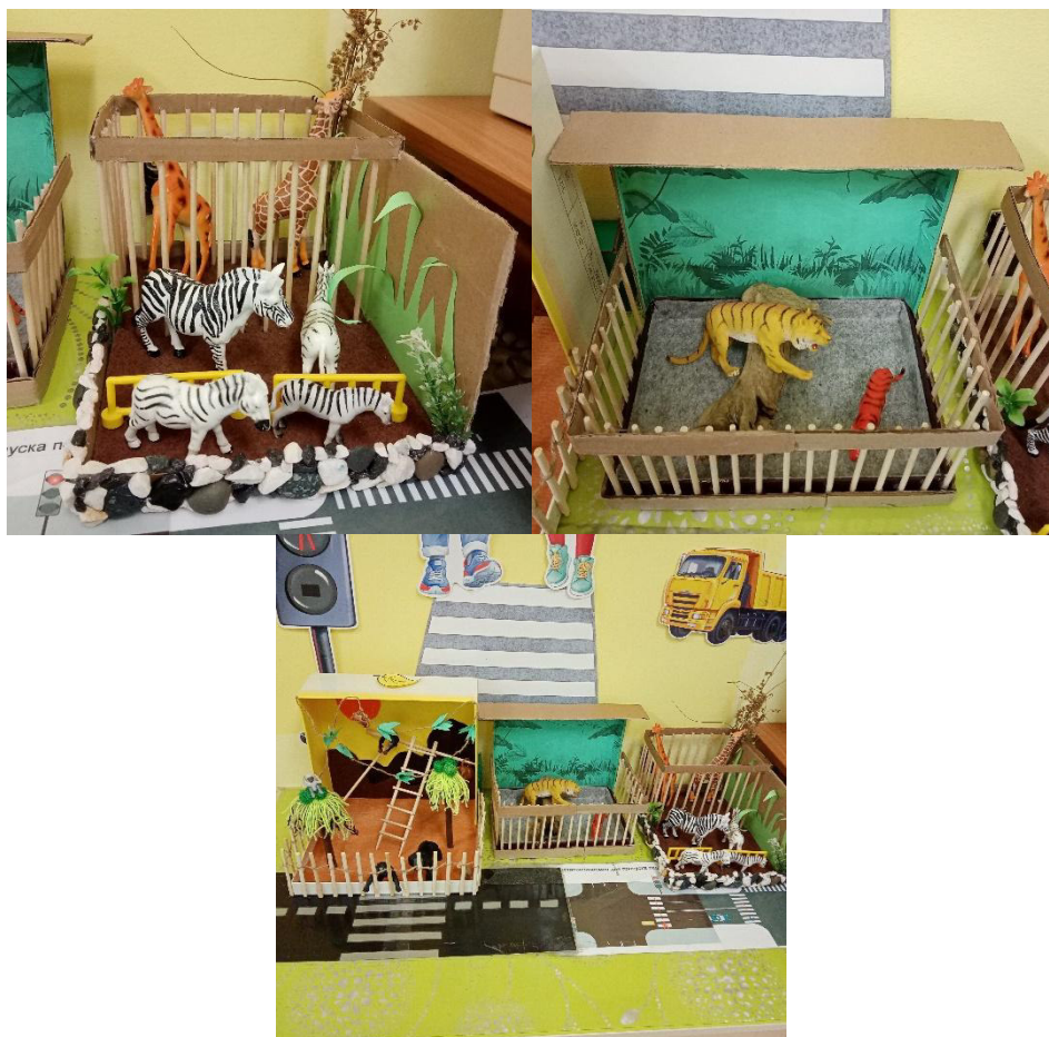
Сюжетно-ролевая игра «Зоопарк»