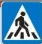
Знак "Пешеходный переход" обозначает место перехода пешеходом дороги

ПРАВИЛО 3: Подземный переход — самый безопасный!