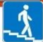
Знак "Подземный пешеходный переход"